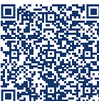
Iran Krieg Sicherheitslage

Die Lage ist und bleibt dynamisch; kurzfristige Maßnahmen wie Routenänderungen, Aussetzungen von Fahrten oder Luftraumsperrungen können jederzeit erfolgen und sich unmittelbar auf internationale Verkehrsströme auswirken. Die Region besitzt zentrale Bedeutung für internationale Öl- und Gastransporte sowie für wesentliche Ost-West-Handelsrouten. Eine nachhaltige Einschränkung dieses maritimen Engpasses hat unmittelbare Auswirkungen auf bestehende Linienverkehre. Alternative Umschlaghäfen im Nahen Osten und in Asien müssen zusätzliche Mengen aufnehmen. Damit steigt das Risiko von Überlastungen, Engpässen bei Liegeplätzen sowie von Verzögerungen, die sich entlang der globalen Fahrpläne fortsetzen. Bleibt zu hoffen, dass die USA und Israel einen baldigen und dauerhaften Frieden mit dem Iran schließen werden. Aktuelle Informationen zur Sicherheitslage im Nahen und Mittleren Osten und die Auswirkungen auf die globalen Lieferketten finden Sie unter NAVIS Aktuell hier .