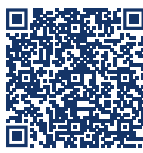
Iran Krieg Versicherungsschutz

Aufgrund der kritischen Sicherheitslage im Nahen und Mittleren Osten haben die meisten Verkehrshaftungsversicherer und Waren-Transportversicherer die Mitversicherung für die Risiken Krieg , Streik, Aufruhr und Beschlagnahmung aufgehoben . Dieser Ausschluss gilt für Transporte von und zu folgenden Ländern im Nahen und Mittleren Osten: Iran, Irak, Israel, Vereinigte Arabische Emirate, Bahrain, Katar, Oman, Kuwait, Syrien, Saudi-Arabien, Jemen, Libanon, einschließlich der Küstengewässer bis zu 12 Seemeilen vor der Küste. Weitere Details und Konsequenzen für Exporteure und Importeure finden Sie unter NAVIS Aktuell hier .